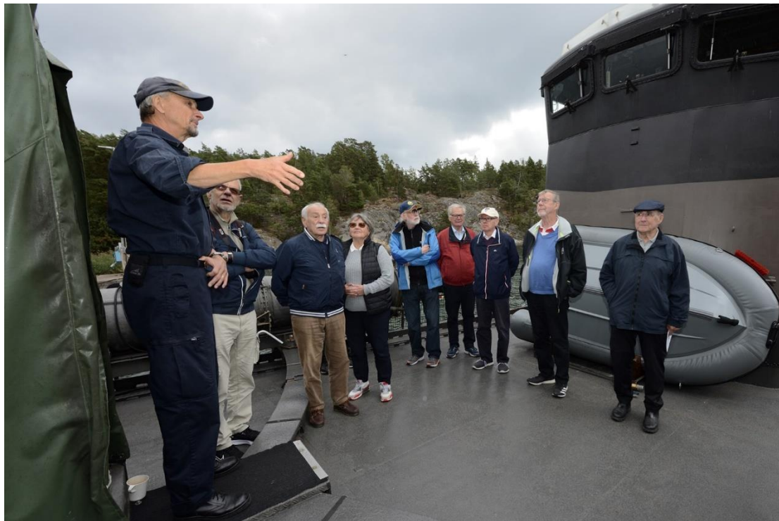
Genomgång på R142 Ystads däck